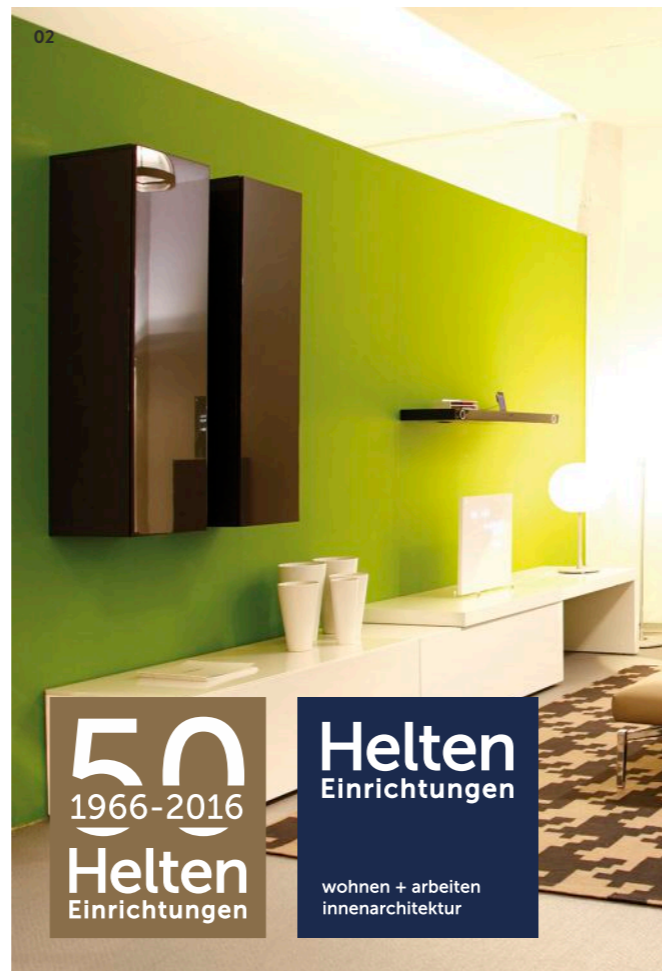
01 USM Haller bei Helten Einrichtungen 02 Einrichtungs- beispiel Helten Einrichtungen

50 1966-2016 Helten Einrichtungen Helten Einrichtungen wohnen + arbeiten innenarchitektur