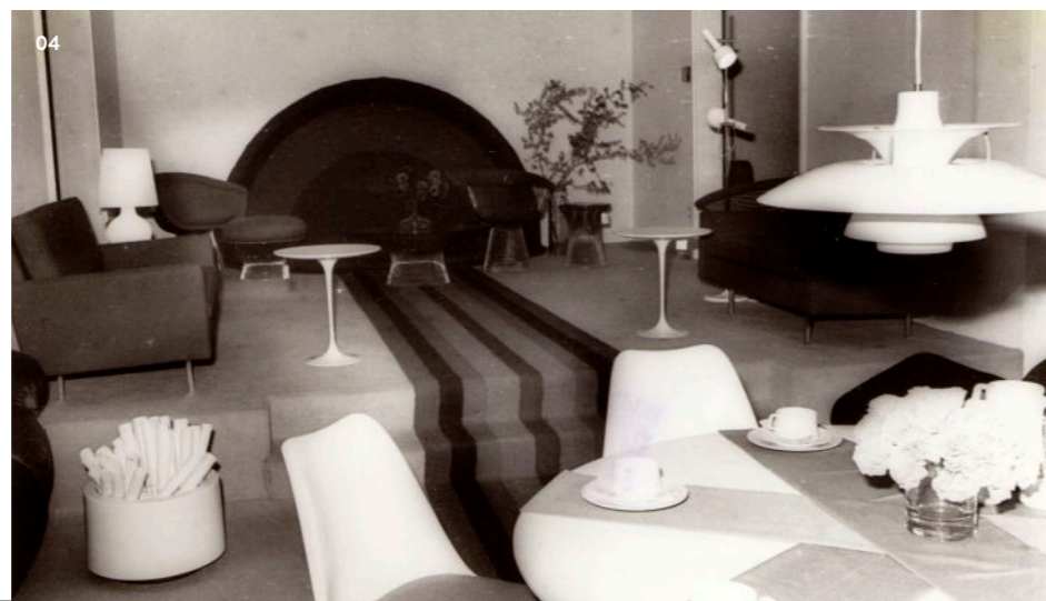
04 Eine der Helten-Jahres- ausstellungen 1972 zum Thema Festival der Sinne