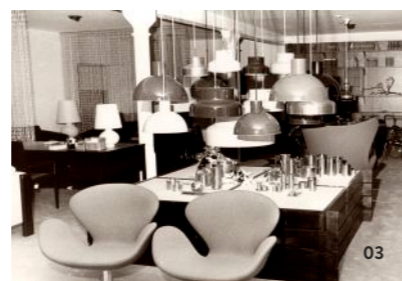
03 Leuchten- studio 1972 Theaterstraße

50 1966-2016 Helten Einrichtungen Helten Einrichtungen wohnen + arbeiten innenarchitektur